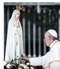
Pred pápežom Františkom do Fatimy, na miesto zjavení Panny Márie, pricestovali Pavol VI. v roku 1967, Ján Pavol II. v rokoch 1982, 1991 a 2000, Benedikt XIV. v roku 2010.