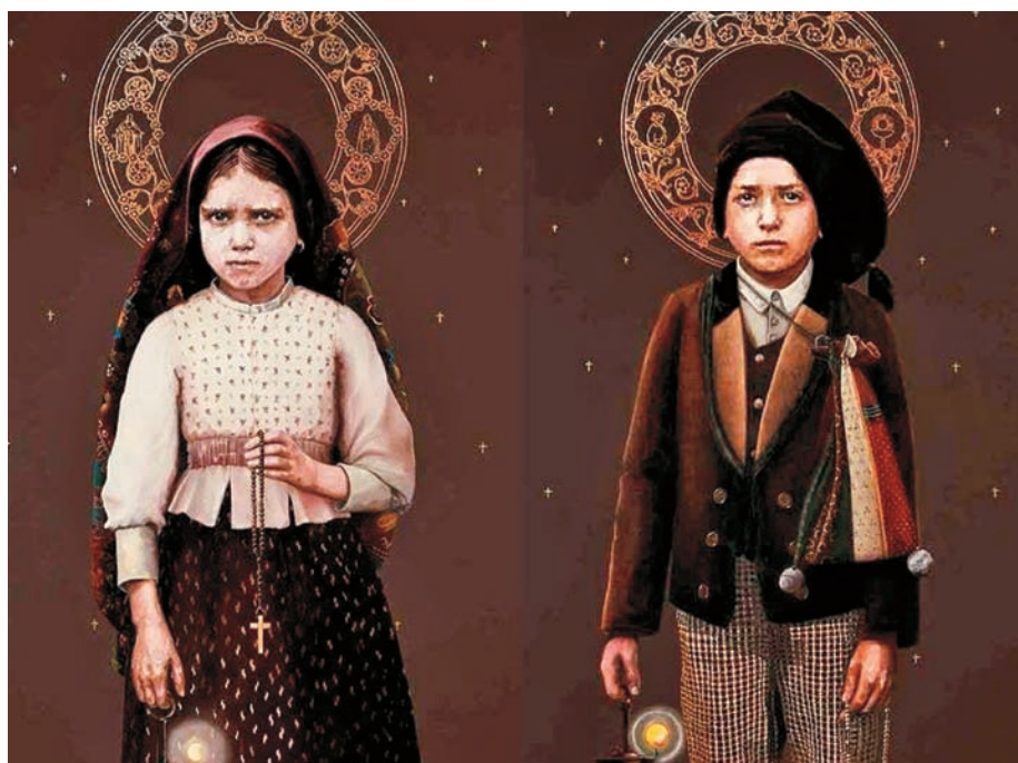
Pápež František dňa 13. mája 2017 kanonizoval dvoch fatimských vizionárov, Hyacitu a Františka Martových.

■ Stále väčšie rozširovanie školskej výučby v zmysle genderovej ideológie kritizoval arcibiskup Vincenzo Paglia, kancelár Pápežského inštitútu sv. Jána Pavla II. pre manželstvo a rodinu. Arcibiskup zhrnul význam rodiny vetou: „Bez rodiny niet nijakej kultúry.“ Vzhľadom na bujnenie tzv. „teórie gender“ zdôraznil, že „bez prirodzeného rozlišovania muža a ženy nemôže existovať ani rodina“.