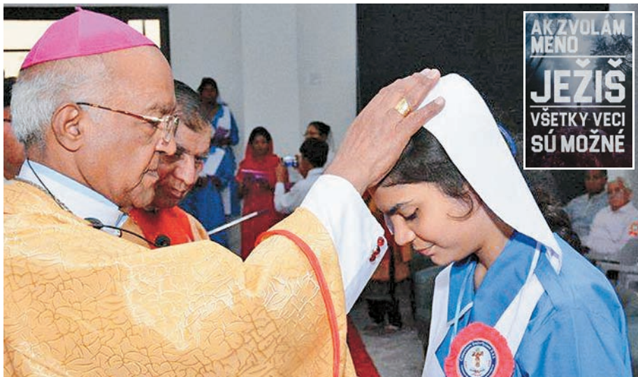
Sviatosť zmierenia - kľúčový krok každého kresťana - katolíka.

Tak sa rodila Terapeutická dielňa sv. Jozefa , v ktorej sa schádzajú osoby s mentálnymi problémami. Ich rodičia a priatelia sa zapojili do medzinárodného hnutia Viera a svetlo . (medjugorje.hr)