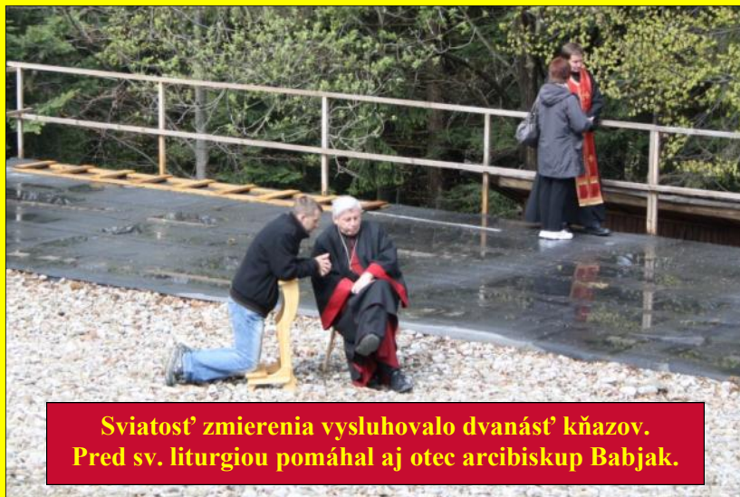
Sviatosť zmierenia vysluhovalo dvanásť kňazov. Pred sv. liturgiou pomáhal aj otec arcibiskup Babjak.