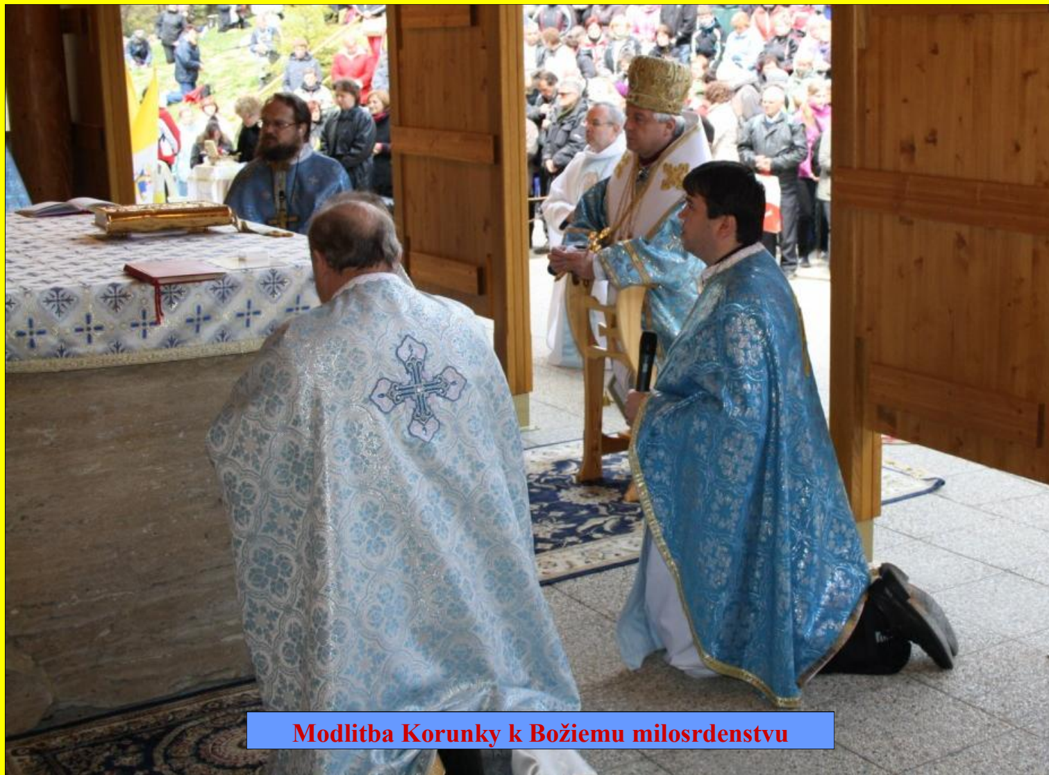
Modlitba Korunky k Božiemu milosrdenstvu