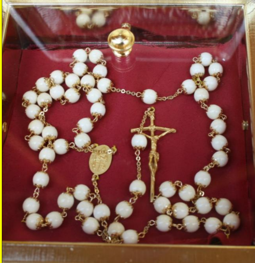
Vzácný dar pre Zvir od krakovského kardinála Stanislawa Dziwisza