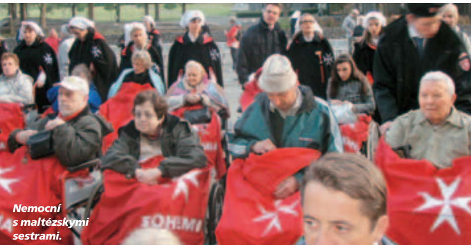
Nemocní s maltézskymi sestrami.

správnú duchovnú rovinu. Poobedňajší ruženec v nemocnici s chorými sa nedá zabudnúť. Každodenná svätá omša bola neskutočným zážitkom.