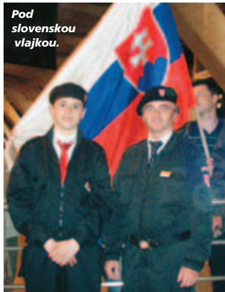
Pod slovenskou vlajkou.

len o odhadzovaní bariel a vozičkov? Každý zázrak je na posilnenie viery. Tých duchovných zázrakov tu bolo neúrekom. Tie úžasné premeny ľudí, zmeny ich správania boli vidieť v každom tíme. Na smrť chorí ožili. Ich pripravené úmrtné listy (pre prípad) boli zbytočné.