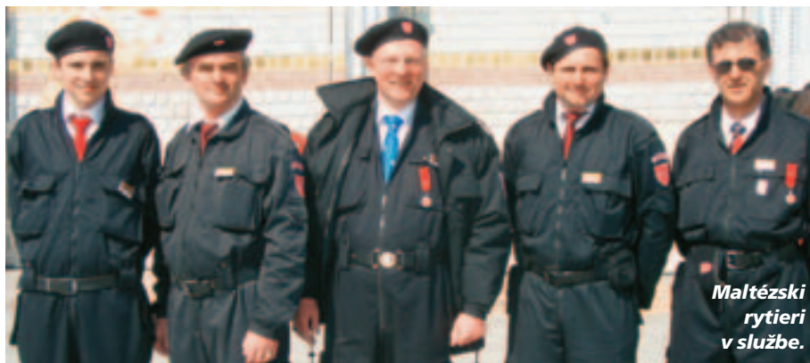
Maltézski rytieri v službe.

Toto boli duchovné cvičenia spojené s pomocou tým najbiednejším. Skorý ranný budiček, nasledovali ranné chvály a modlitby. Prítomní kňazi úžasným a príjemným spôsobom naladili všetkých na tú